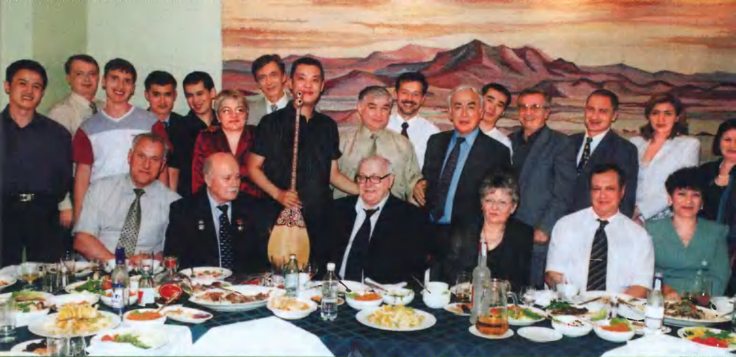
Фотография на память о встрече в Москве.