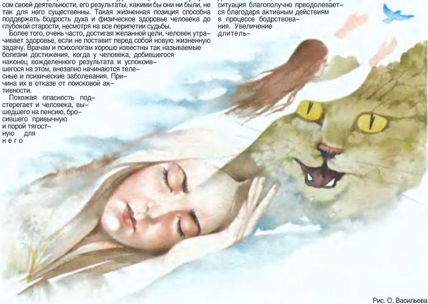
Рис. О. Васильева

Если стресс приводит к уменьшению продолжительности парадоксального сна, это означает: стрессовая ситуация благополучно преодолевается благодаря активным действиям в процессе бодрствования. Увеличение длитель-