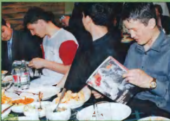
Гости знакомятся с журналом «Чудеса и приключения».