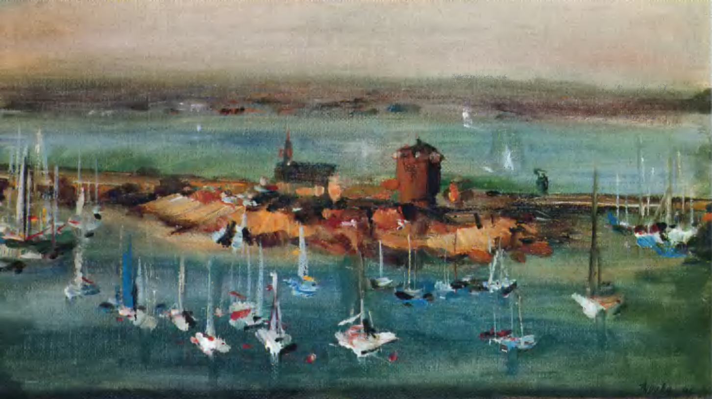
Самара. Вид на гавань