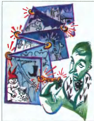
Рис. В. Плужникова