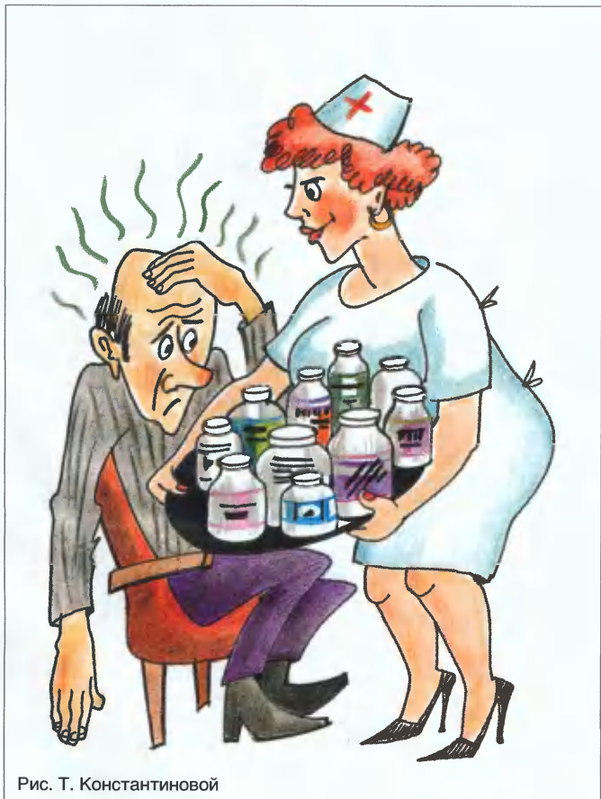
Рис. Т. Константиновой

Прежде всего вас должно насторожить предложение врача купить лекарство прямо у него. Если он отправляет вас за якобы чудодейственным импортным средством на фармсклад, это тоже сигнал, что дело нечисто. В обоих случаях проконсультируйтесь у другого врача или хотя бы в аптеке. Так вы сохраните не только деньги, но и здоровье. А это главное.