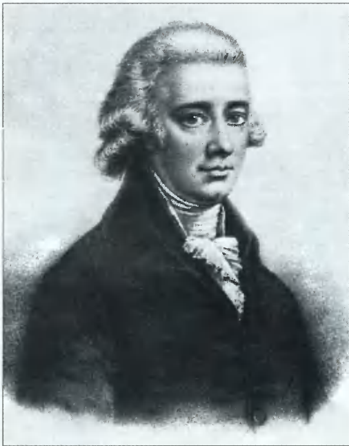
Питт Младший (1759 — 1806). Коллекция Виоле.