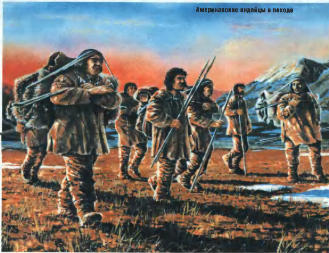
Американские индейцы в походе