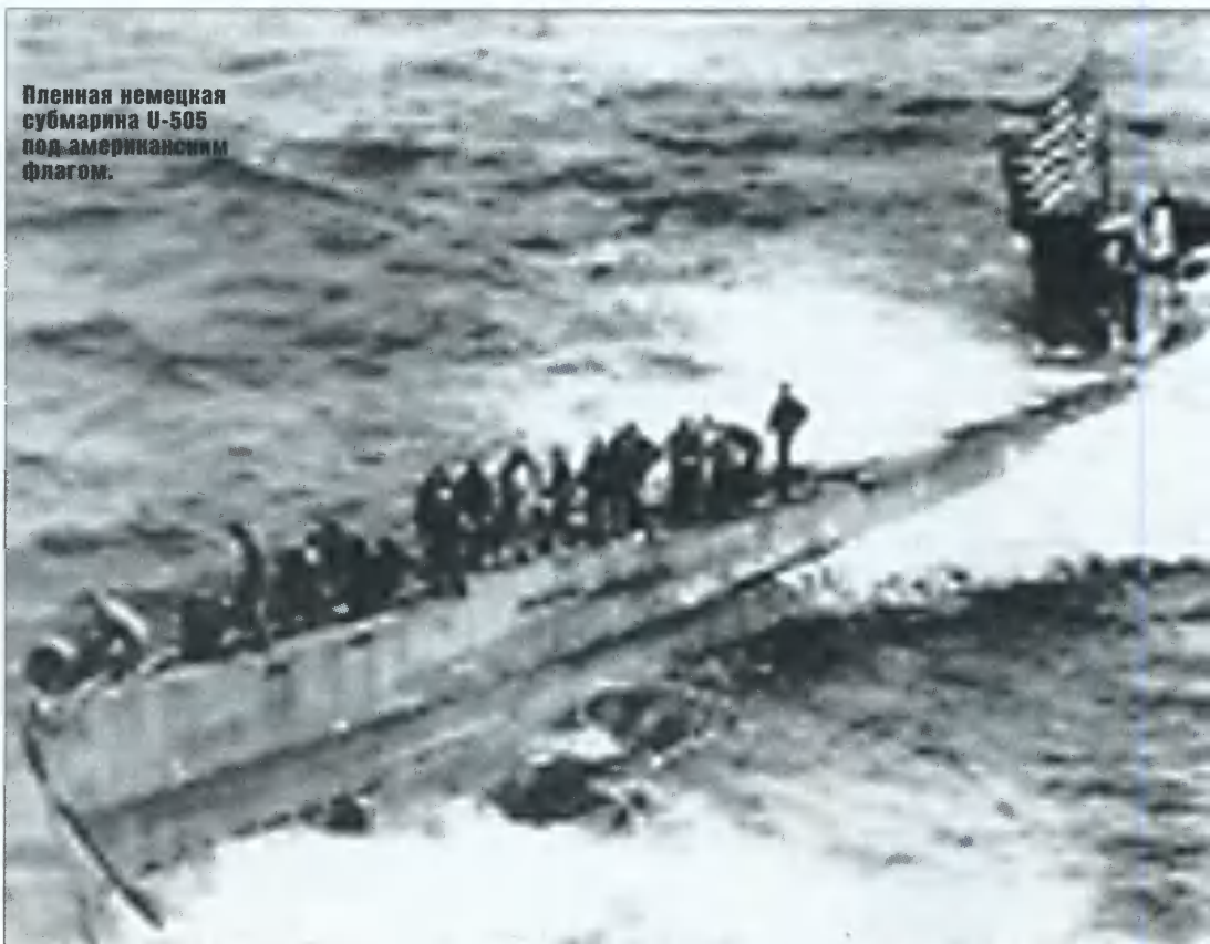
Пленная немецкая субмарина U-505 под американским флагом.