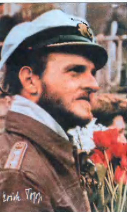
Эрих Топп в годы войны.

«ПЯТНИЦА, ТРИНАДЦАТОЕ — ЖДИ БЕДЫ!» — ЭРИХ ТОПП