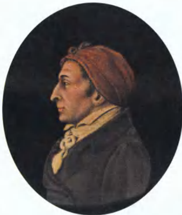
Жан-Поль Марат (1743—1793). Барельеф работы неизвестного мастера XVIII в. Воск. Музей Института Маркса—Энгельса—Ленина.