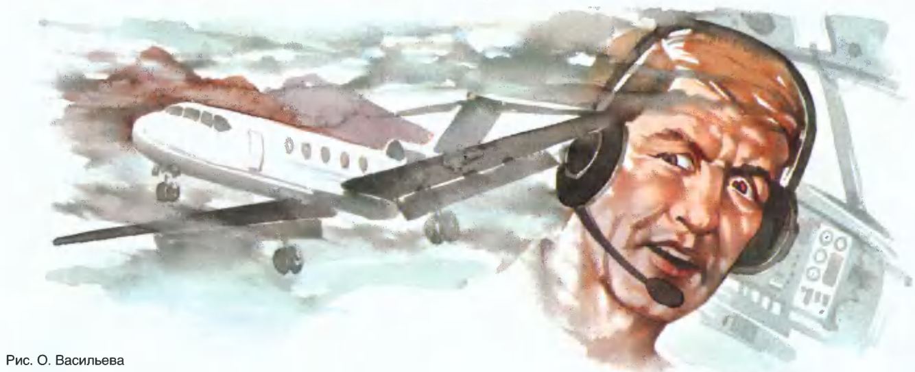
Рис. О. Васильева

точника, деформирующего радиоволны? В подобную ситуацию мне приходилось попадать. Решаю снижаться. Докладываю диспетчеру о начале снижения и называем высоту, до которой снижаемся. Надеюсь, что с изменением высоты полёт самолёт выйдет из зоны генерирующего облучения и связь восстановится. Володю прошу перейти на запасную частоту передатчика и на ней поработать с диспетчером. Переходит, работает — результат тот же.