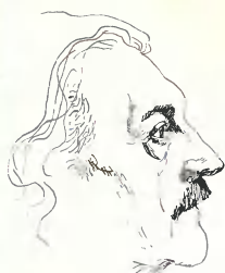
ЖУРНАЛ ОСНОВАЛ ВАСИЛИЙ ЗАХАРЧЕНКО В 1991 ГОДУ